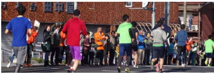
応援風景（中間地点関門周辺）