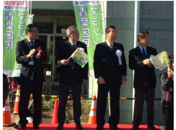
ラストスパート応援