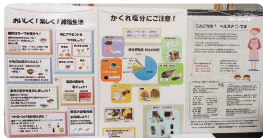
手作りパネルで食育、健康づくりの大切さを啓発