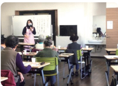
地域ケアプラザや学校等で食育講座を開催

青葉区では健康的な食事や、食べることの楽しさを学ぶことができる「食育」に取り組んでいます。地域で食育を推進している青葉区食生活等改善推進員会(愛称:ヘルスマイト)は、「私たちの健康は私たちの手で」のスローガンのもと、自分自身、家族、そして地域の健康づくりのための活動を行い、地域で健康づくりの輪を広げています。災害時の食生活パネル展・講習会などにも取り組んでいます。