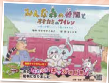
原作は現役消防職員による書き下ろし

【原作】なとりまさあき 【絵】福ヨシトモ 【発行】(株)野毛印刷社 【販売価格】1,400円(税別) 【販売場所】書店や通販サイト