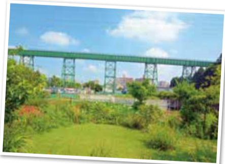
▲青空に映える美しい水路橋

導水路は、100メートル進むと6センチメートル下がる勾配で、古代のローマ水道と同じ方式で水が流れる構造になっています。