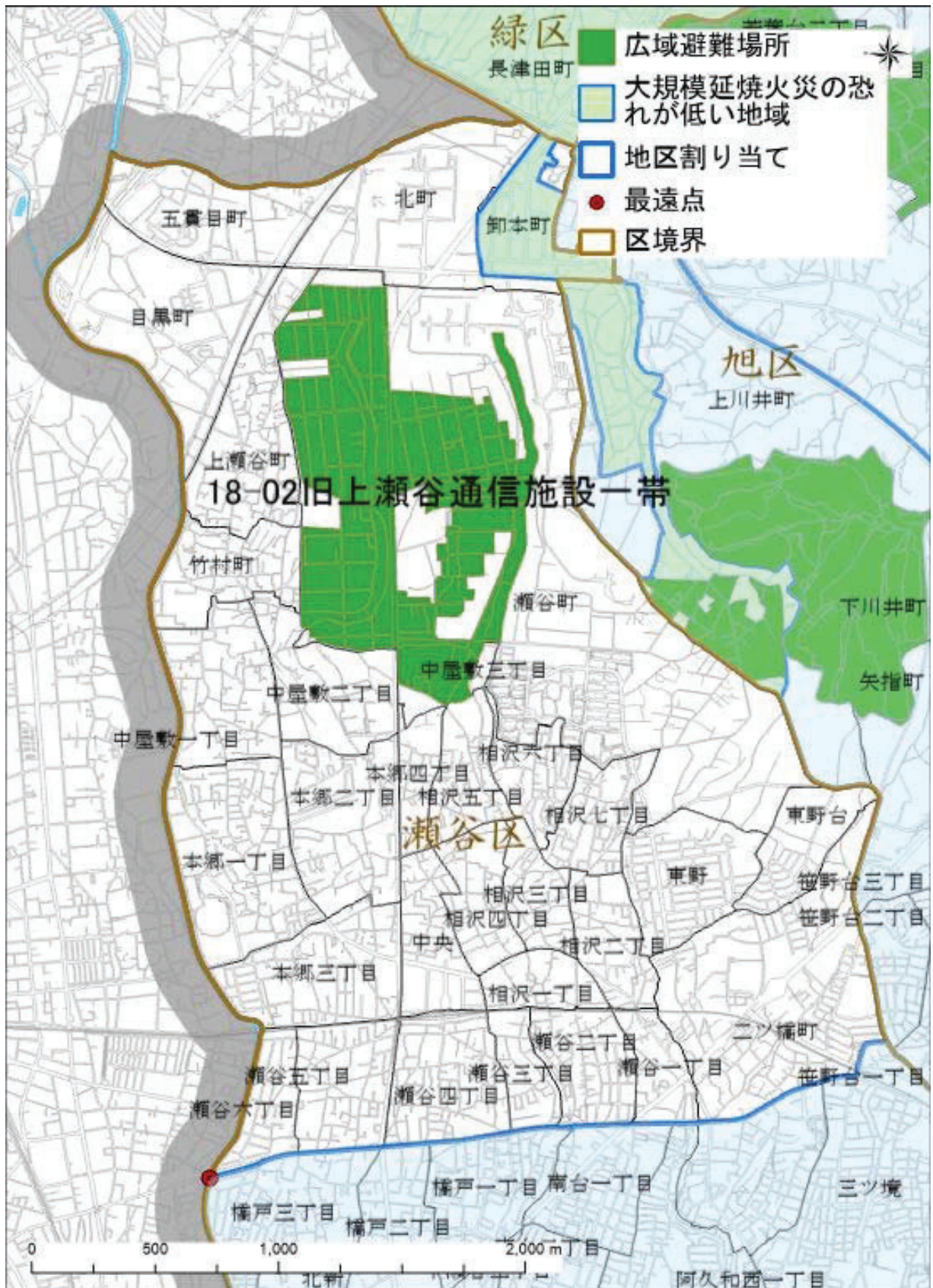
最遠点: 広域避難場所の外縁部から直線距離で最も離れている地区割り当ての端点