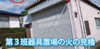
第3班器具置場の火の見櫓