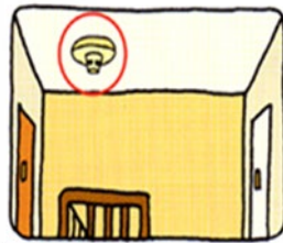
寝室がある階の階段