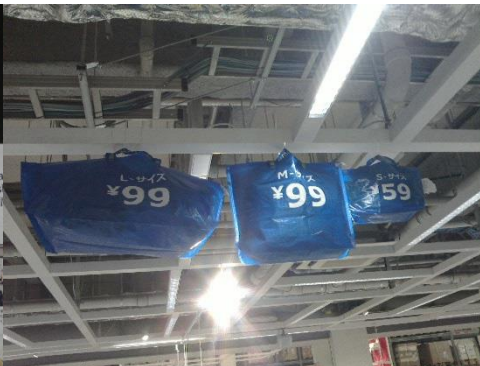
レジ袋削減に向けた取組の推進