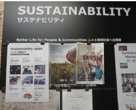
従業員への環境教育の実施