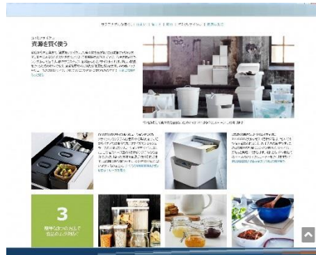
消費者に対するPRの推進