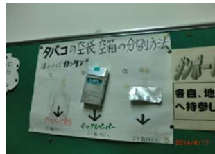
ワンポイントレッスン