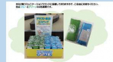
自社ロゴ入りエコバッグの作成・配布