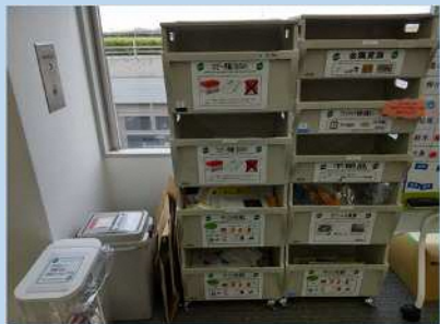
事務棟フロアに分別ボックスを設置