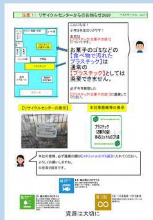
月1~2回の ゴミ等に関するお知らせ