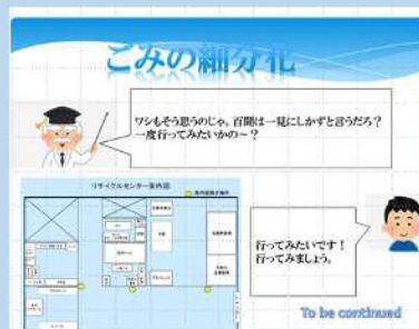
新入社員や中途社員向けの 教育