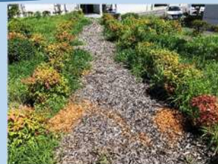
植栽樹木の再利用 ・ 剪定・伐採した樹木をウッドチップとして再利用