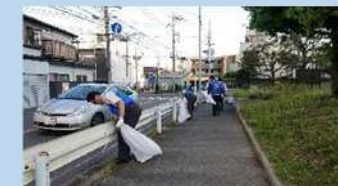
社会貢献活動として、 毎年会社周辺のゴミ拾いを実施