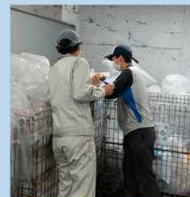
分別確認パトロール