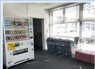
木くず・金属くず・古紙・ペットボトル・ビン・缶のリサイクル