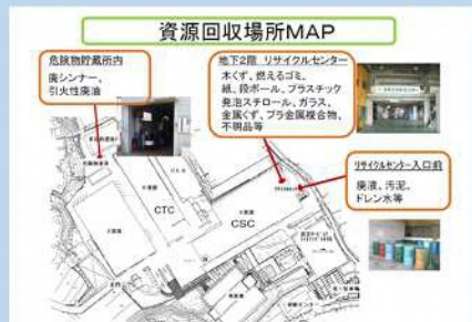
分別ごみの回収場所一覧