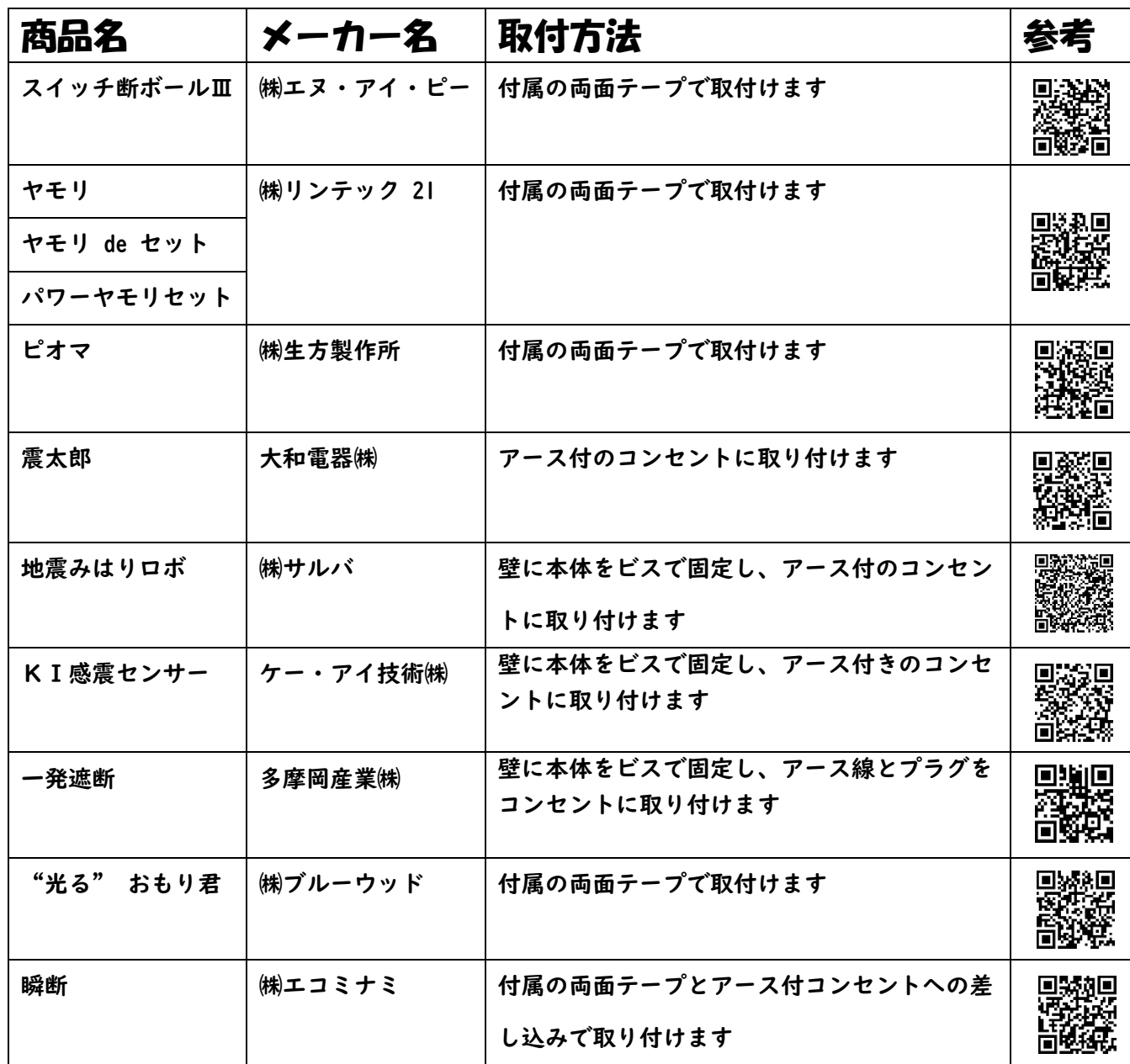
■表 1 補助対象器具