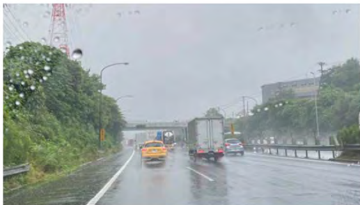
①水押橋 : 瀬谷区五貫目町付近 (ターポリン・片面)