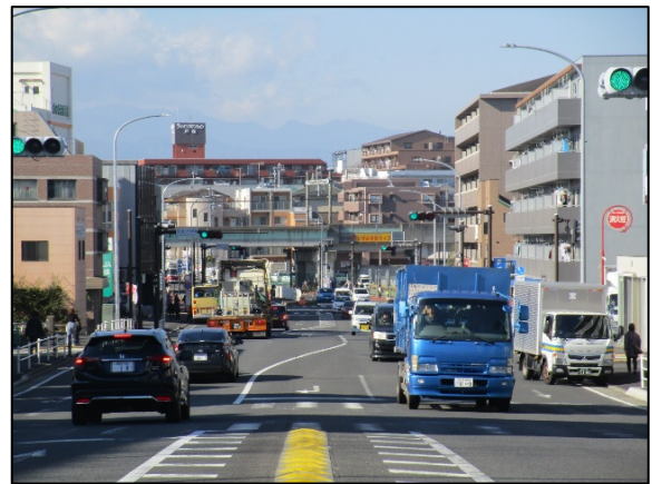
本市での無電柱化実施例（横浜伊勢原線）【令和元年完成】