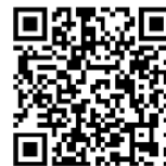
ホームページのQRコード

https://www.toshiseibi.metro.tokyo.lg.jp/kiban/gouu_houshin/kyuutokenshi.html