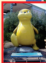
受付場所：シーパラシー太モニュメント