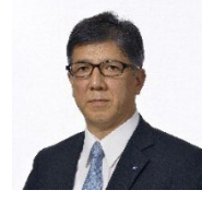
城 博俊／横浜市副市長