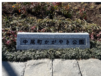
児童の投票で決まった公園名

公園整備についての授業を行い、その中で公園名や遊具、柵の色の選定、樹名板の作成等を行いました。