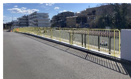
柵の色も児童が考えてくれました。公園の雰囲気明るくなりました！