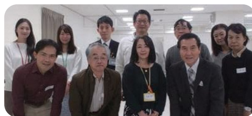
キックオフミーティングの様子

仕事経験を地域活動に活かせることが実感できました。また、横浜にゆかりのある方々とチームを組み、モチベーションに繋がりました。 (30代男性)