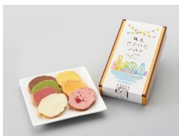
◀プチ・フルール 「横浜にじいろラスク」 (7枚入り)