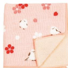
◀濱文様 「和たおるセミウォッシュ」 (1枚) ※柄はランダムです。