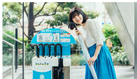
レンタルスポット