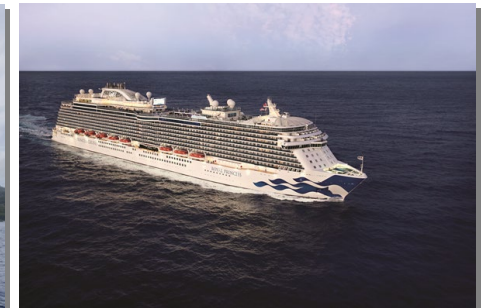
ロイヤル・プリンセス