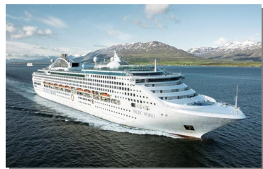
パシフィック・ワールド