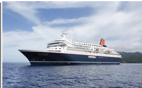
につぼん丸