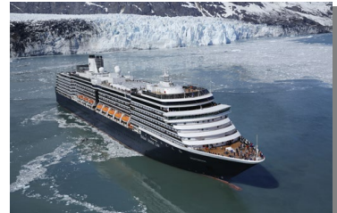
ウエステルダム