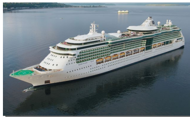
セレナーデ・オブ・ザ・シーズ