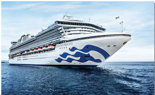
ダイヤモンド・プリンセス