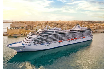
リビエラ