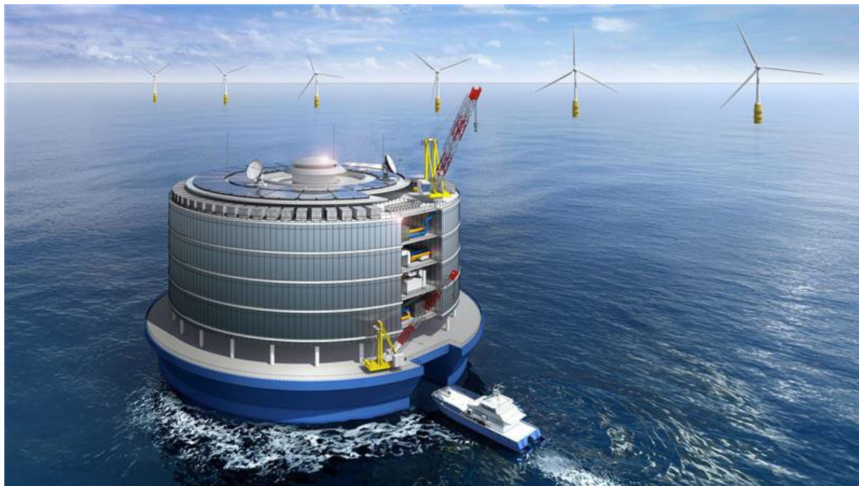
洋上浮体型グリーンデータセンター イメージ図