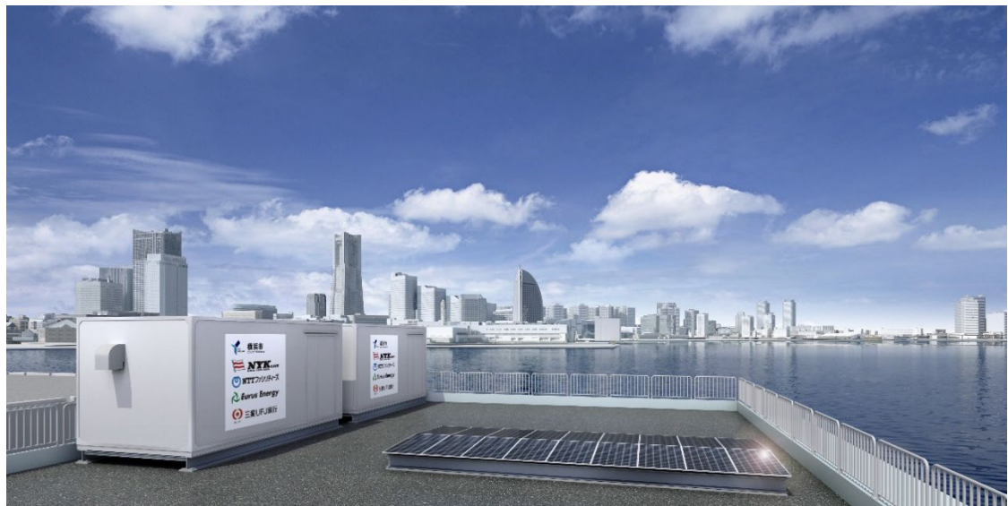
実証実験 イメージ図