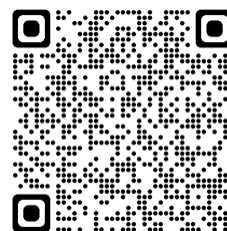
横浜港におけるカーボンニュートラルポートの取組