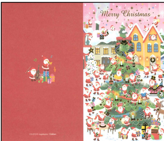
グリーティングカード

寄附いただいた図書カードについては、中区社会福祉協議会の善意銀行を通じて、社会福祉に役立てていただきます。