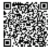
▲コンテストの ホームページ