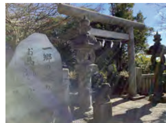
2022年度 小中学生部門金賞 《本牧の光の入り口》