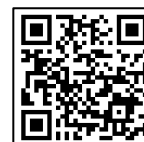
横浜市民防災センター Facebook