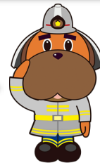
横浜市消防局 マスコットキャラクター 「ハマくん」

市民の皆様が安心して年末年始を過ごせるよう、 出火防止・予防救急の広報、消防車による地域巡回、そして 季節性インフルエンザなどの救急需要を見据えた体制を確保する 「年末年始消防特別警戒」を実施します。