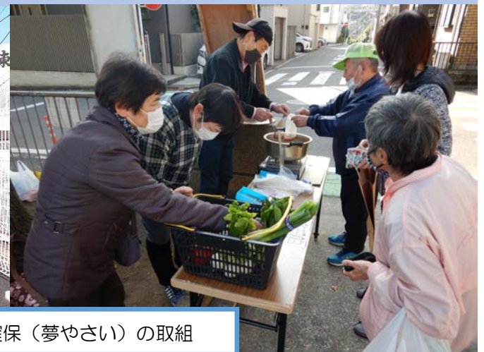
資金確保（夢やさい）の取組