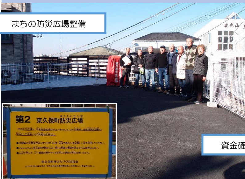
まちの防災広場整備