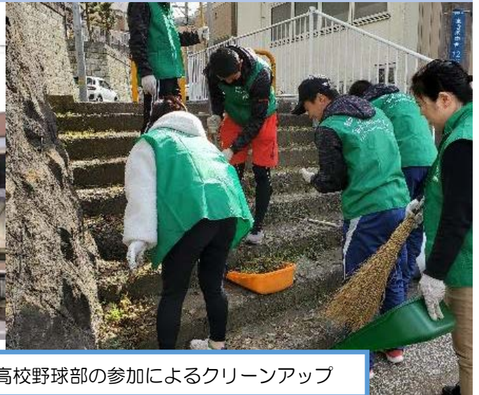
地域の高校野球部の参加によるクリーンアップ