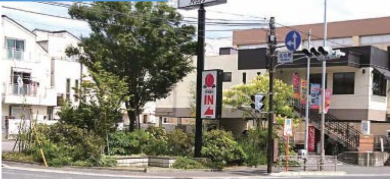
国道1号線沿いにある 店舗の緑化協力