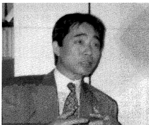
南学 (企画局調査課長)

それが世界の最先端につながる一流の研究施設・研究拠点であり、さらに大学とも連携する。つまり横浜市として一つのセクションではなく全庁的な、かつ戦略的な事業として取り組むべき事業だと思えます。さらに市長の主張にもあるとおり福祉を支