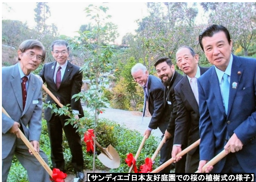
【サンディエゴ日本友好庭園での桜の植樹式の様子】

平成 29 年 4 月 26 日 【発行】横浜市国際局政策総務課 企画担当 045-671-4710 ki-somu@city.yokohama.jp