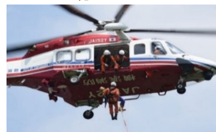
<消防ヘリコプター>