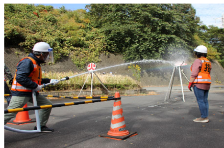
<地域住民による初期消火訓練>