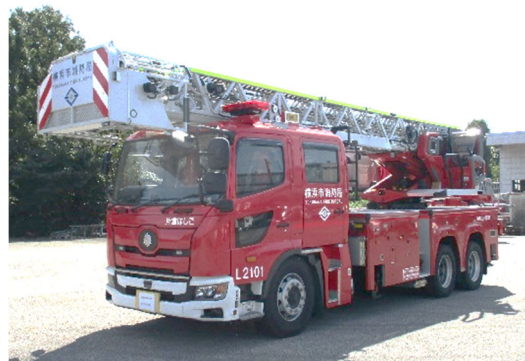
<はしご付消防自動車>