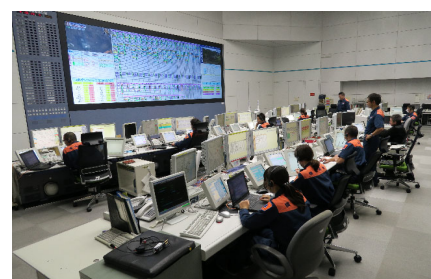
<消防司令センター>