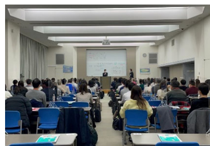
<防火・防災管理講習>

また、消防操法訓練会の開催等を通じて、自主防火・防災管理を推進し、事業所防災力の向上に取り組みます。