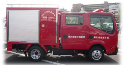
<積載車のイメージ>