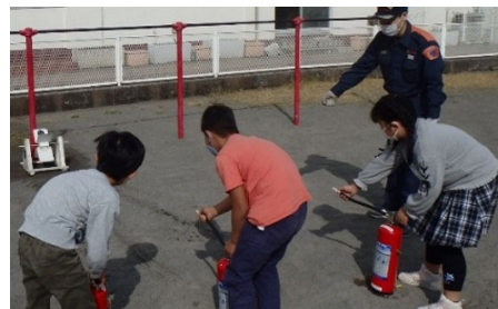
<お出かけ防災教室>

また、市民利用を開始する「よこはま防災e-パーク」や創設65周年を迎える横浜市消防音楽隊によるコンサート、防災動画の配信による広報等を通じて、市民の皆様の自助・共助及び防火・防災意識の高揚を図ります。