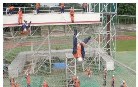
<初任基礎教育訓練>