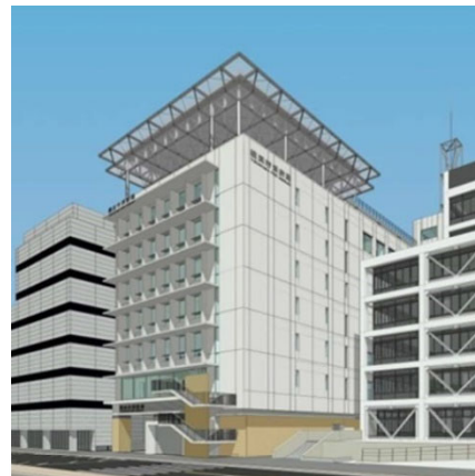
<消防本部庁舎イメージ>

令和5年10月に開庁予定の消防防災活動の中核となる消防本部庁舎について、4年度に引き続き、建設工事及び消防通信指令システム設備更新工事等を行います。