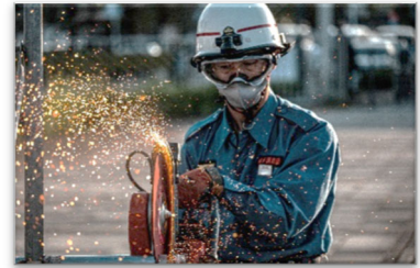
<消防団員の活動状況>