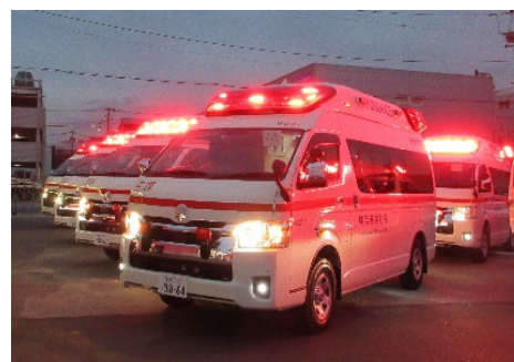
<高規格救急自動車>