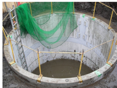
<防火水槽新設工事>

さらに、防火水槽の標識柱や蓋などの消防水利施設を適切に維持管理することで、火災時における迅速な消火活動につなげます。