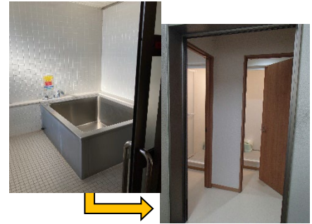
<執務環境改善（浴室の個室化）>