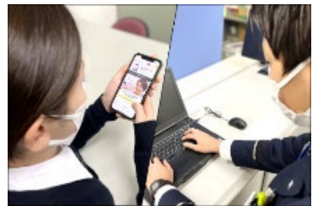
<電子申請及び受付のイメージ>

さらに、産学官連携により消防の科学技術の更なる高度化を推進するとともに、科学的根拠に基づく鑑識・鑑定により、火災原因の究明を行います。