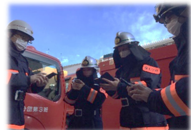
<アプリを操作する消防団員> (イメージ)