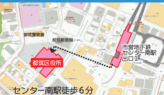
センター南駅徒歩 6 分

平成 28 年 6 月 5 日 (日) 14:00 ~ 16:20 (開場 13:30) 横浜市立大学 ビデオホール ◀◀申込締切 6 月 2 日 (木)▶▶