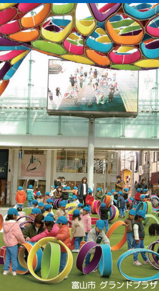
富山市 グランドプラザ

平成 28 年 5 月 22 日 (日) 13:00 ~ 15:20 (開場 12:30) 都筑区役所 6 階大会議室 ◀◀申込締切 5 月 19 日 (木)▶▶