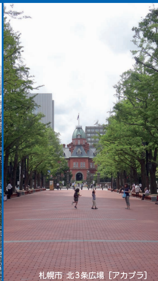
札幌市 北3条広場 [アカプラ]

平成 28 年 6 月 5 日 (日) 14:00 ~ 16:20 (開場 13:30) 横浜市立大学 ビデオホール ◀◀申込締切 6 月 2 日 (木)▶▶