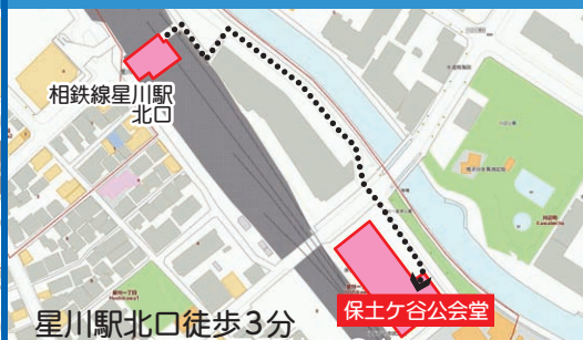
星川駅北口徒歩 3 分