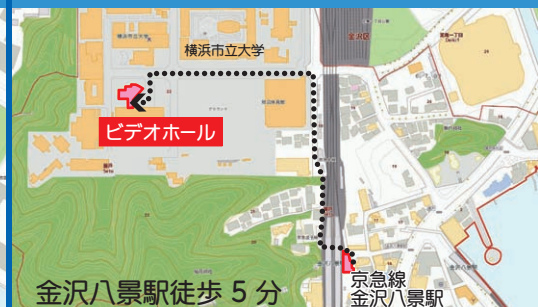
金沢八景駅徒歩 5 分