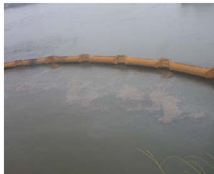
平成 24 年度 調査時