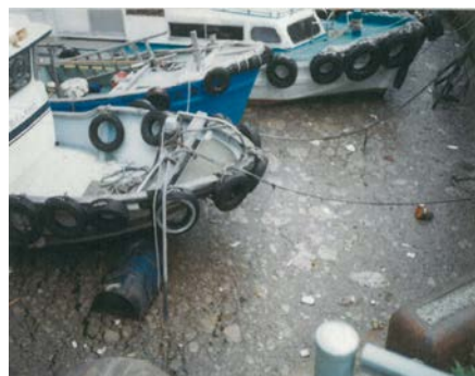
平成 6 年 油性スカム流出時

油性スカムの流出対策として、管きょ内の清掃や幹線管きょの整備等を実施した結果、流出状況の改善が見られたため、現在も発生源対策として、幹線の再整備や効果的な管清掃を継続的に実施しています。また、既設雨水滞水池の運用改善等の緩和策を併せて実施していますが、粒径の小さい油性スカムについては除去が困難です。したがって、粒径の小さい油性スカムに対して最も効果がある高速ろ過施設の整備が必要となります。