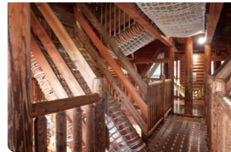
洋光台駅前公園こどもログハウス