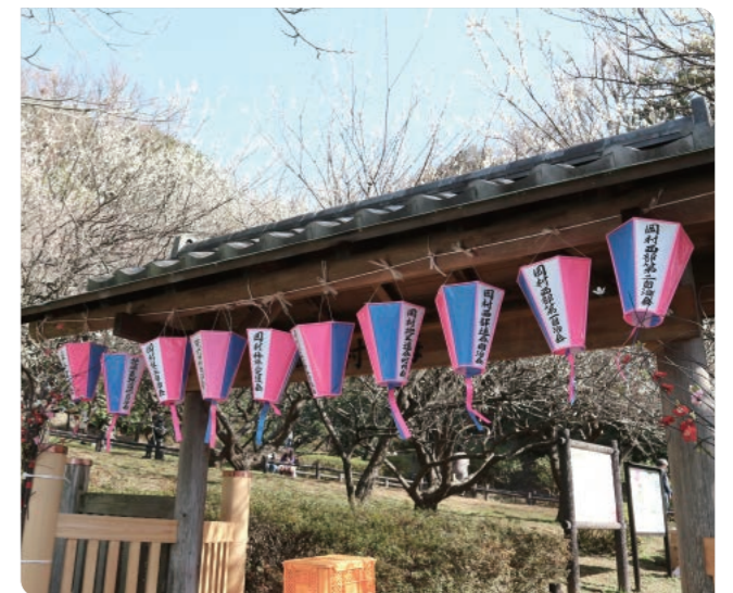
岡村梅林梅まつり