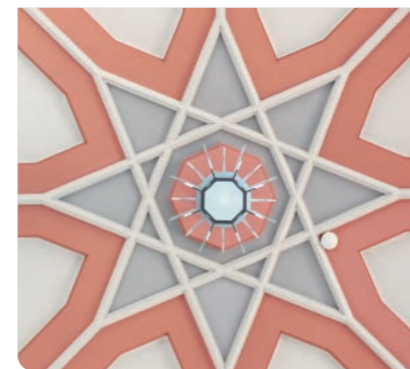
旧東伏見邦英伯爵別邸（貴賓館）