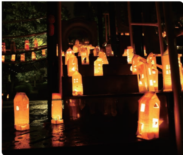
キャンドルナイト@洋光台