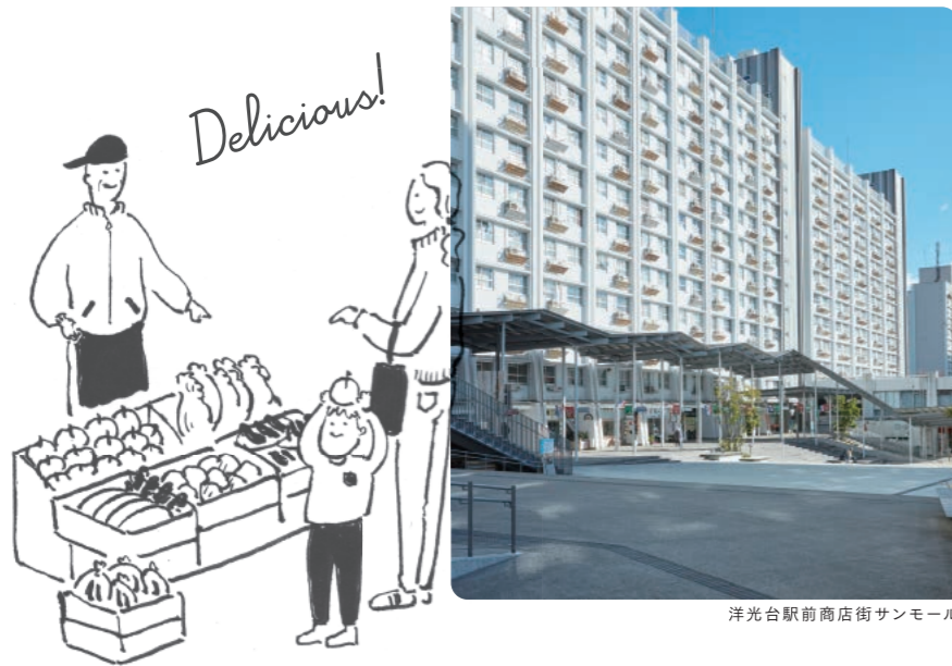
洋光台駅前商店街サンモール

このまちの人々に愛されているこだわりの逸品。にぎやかな商店街でのいつものやりとり。まちを歩けば隠れた名店も見つかるかも。食べると思わず笑顔になる「おいしい」に出会えるまちで、家族や友人と楽しい暮らしを。