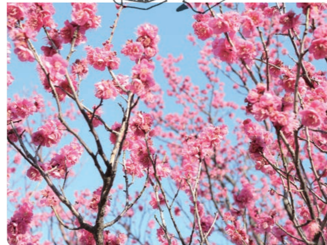
杉田梅林ふれあい公園