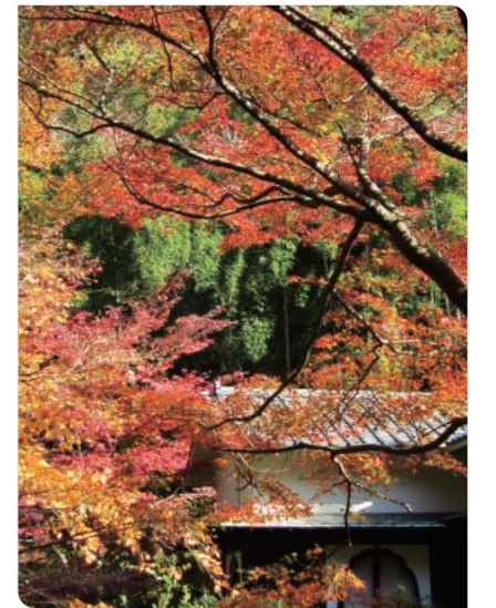
久良岐能舞台庭園