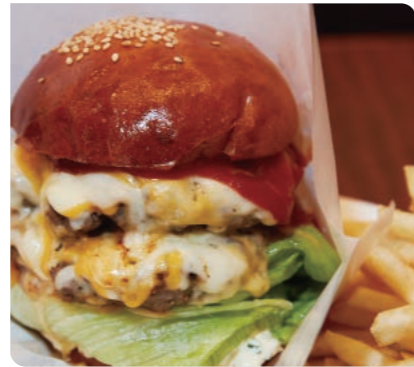
洋光台ハンバーガーPass Time