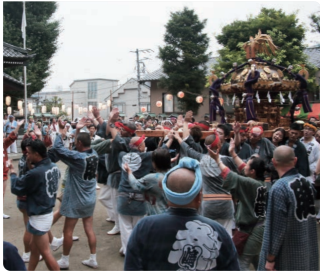
杉田八幡宮例大祭