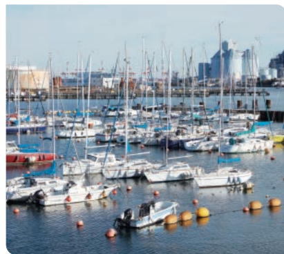
横浜市民ヨットハーバー

心地よい潮風を感じて、海を見ながらゆっくり散歩に出かける休日の昼下がり。遠くに浮かぶ貨物船とかすかに聞こえる汽笛。日が暮れるころ、目の前に広がるのは工場夜景。暮らしの中の海は、毎日同じようであり、少しずつ違う景色を見せてくれる。