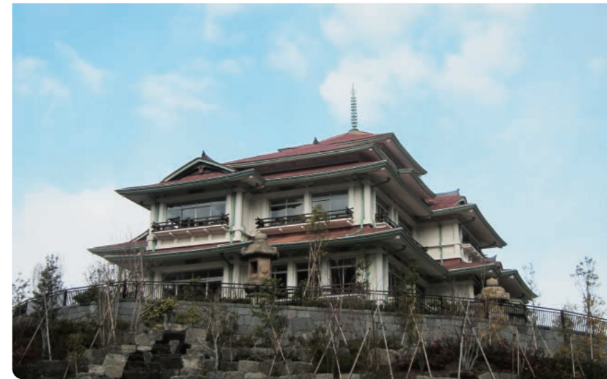
旧東伏見邦英伯爵別邸（貴賓館）