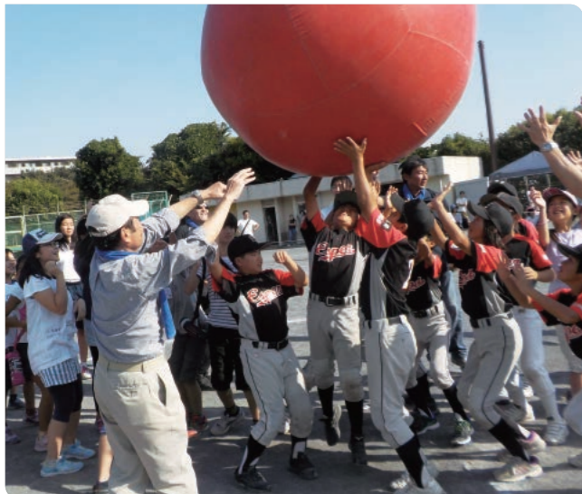
汐見台地区健民祭