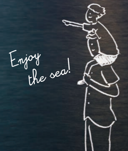
ENEOS (株) 根岸製油所