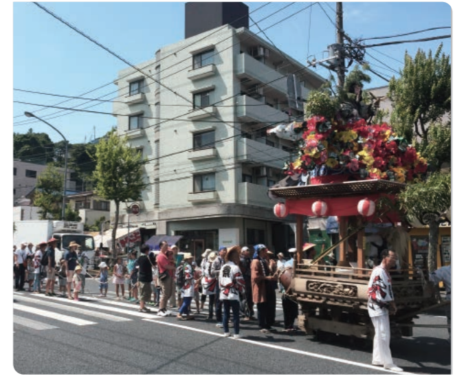
森浅間神社例大祭