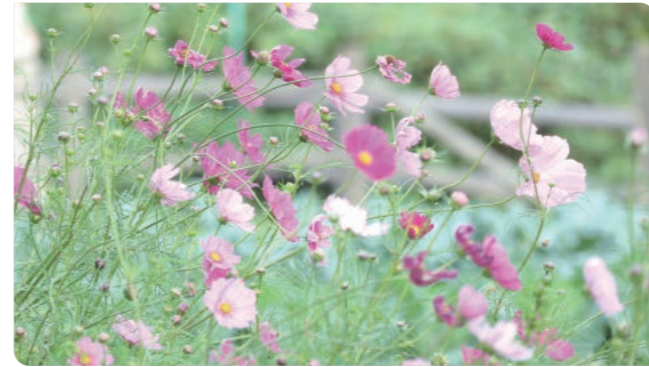
氷取沢農業専用地区