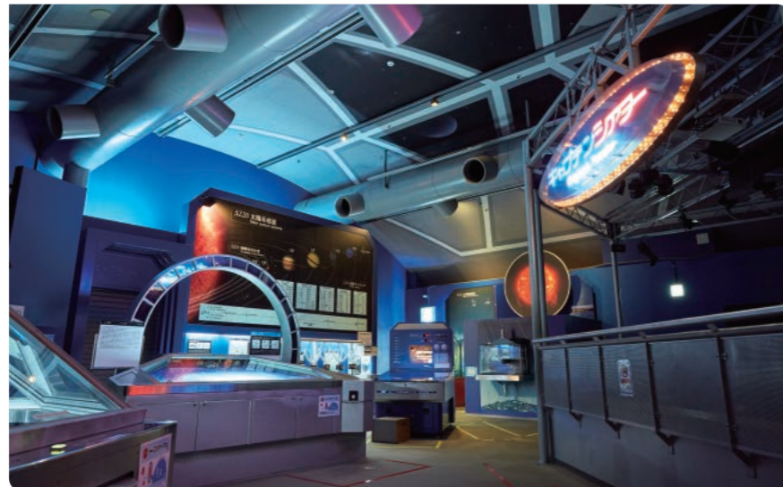
はまぎん こども宇宙科学館