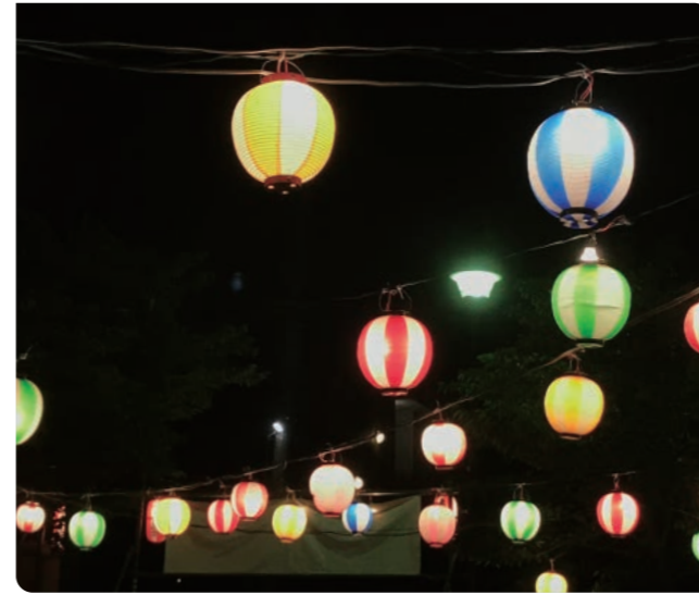
五町会合同盆踊り大会