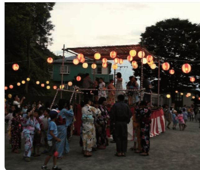
洋光台三丁目納涼夏祭り