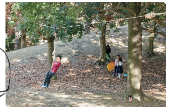
洋光台駅前公園プレイパーク