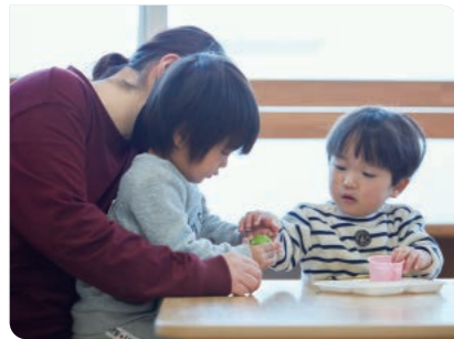
磯子区地域子育て支援拠点 いそびヨ