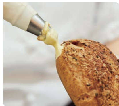
パティスリー アン・グーテ