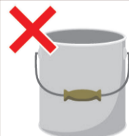
塗料などの空き缶