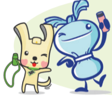
へら星人 ミーオ 減らす