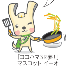
「ヨコハマ3R夢」マスコット イーオ