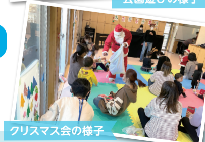
クリスマス会の様子