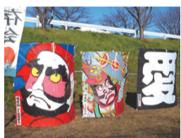
昨年度開催の様子