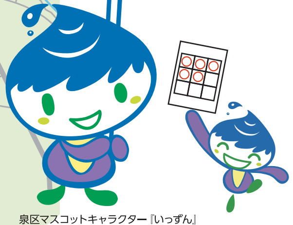
泉区マスコットキャラクター「いっずん」

スタンプラリーに 参加してね! 抽選でいっずんのぬいぐるみが 当たるぞん! (詳しくは2ページへ)