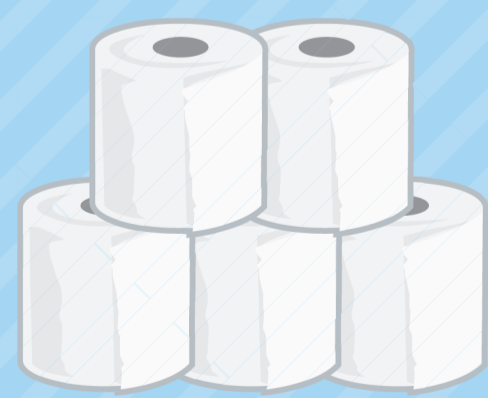
トイレトペーパー