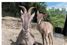
スーチョワンバーラルの親子 (6/4生まれ/7月13日撮影)