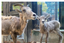
オオツノヒツジの親子 (6/18生まれ/7月5日撮影)

※天候や赤ちゃんの体調によっては、健康管理のため展示を見合わせる場合がありますので、あらかじめご了承ください