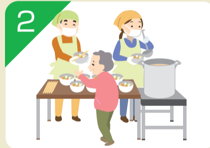
2 水・食料などの配布