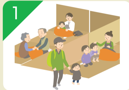
1 一時的な避難生活