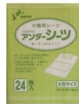
光洋 防水シート・使い捨てシート アンダーシート