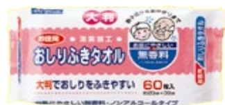
カナッペ おしりふきタオル（60枚入）