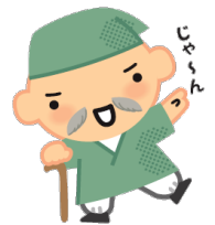
マスコット キャラクター 健康ほうし君