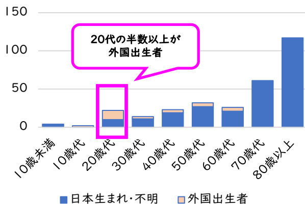
(人) 横浜市 年代別・新登録結核患者(2023年)

全国同様、横浜市でも若年層の結核患者は、外国出生者が増えています。今後、結核高まん延国からの在留外国人の増加とともに外国出生者結核の増加が予想されます。