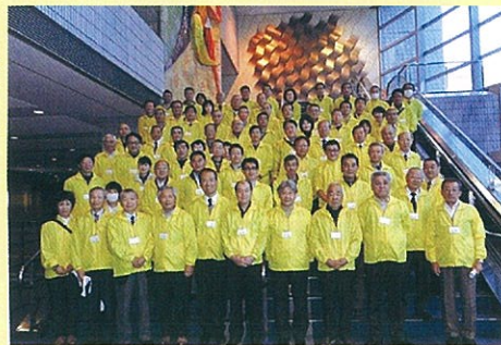
当日参加の青少年指導員

平成27年1月12日(祝)、横浜アリーナにて「成人の日」を祝うつどい」が開催されました。式典は、市内の新成人有志により結成された実行委員会が運営しています。私たち青少年指導員は、席の誘導など、式典が無事に運営できるよう、毎年お手伝いをしています。輝くような晴れ姿の新成人たちに心をこめて、「おめでとうございませう」と声をかけながら席への誘導などを行いました。