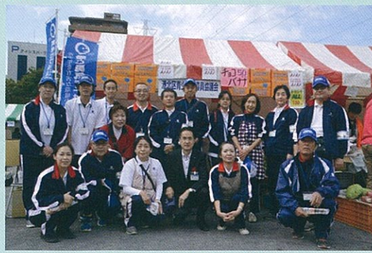
区長と一緒に青指ブース前で

平成26年10月18日(土)、「2014ふるさと港北ふれあいまつり」が横浜F・マリノス公式チアリーディングチーム「トリコロールマーメイド」による華やかなオープニングで、新横浜駅前公園野球場にて開催されました。会場では区内の自治会町内会・行政・各種団体が80を超えるブースを出店。いずれも自慢の料理・お菓子・飲み物を用意し賑わいを見せていました。