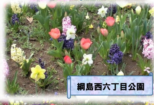
網島西六丁目公園