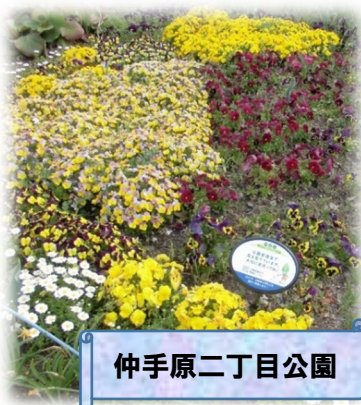
仲手原二丁目公園