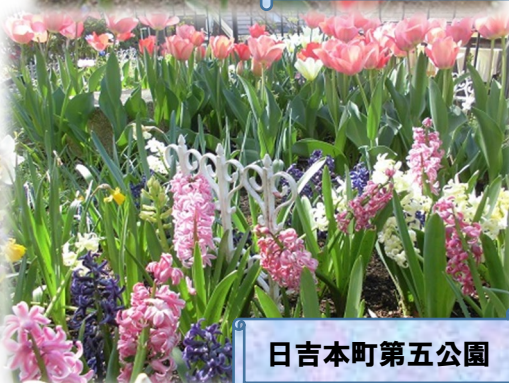
日吉本町第五公園