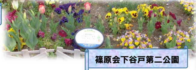
篠原会下谷戸第二公園