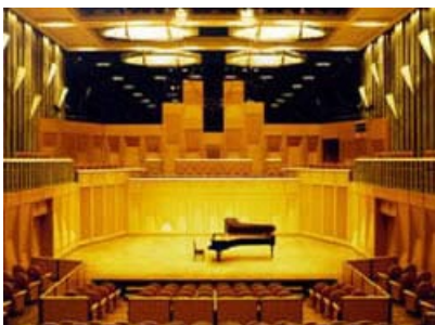
音楽系ホール：残響時間が長くなるように設計されておりクラシック演奏に適しています。 (写真：港南区)

他区の区民文化センターでは、音楽系ホールや演劇系ホールなど特定の用途に特化したホールが整備されたこともありますが、近年では技術の進歩に伴い多目的ホールでも十分な音響性能が確保できるようになったことなどから、多目的ホールが整備されるケースが多くなっています。