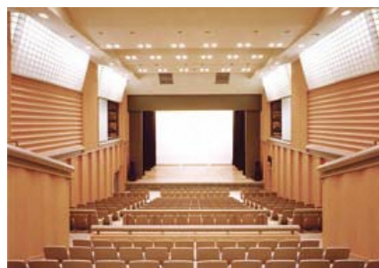
多目的ホール：区民文化センターで最も多いタイプ。可動式の音響反射板を用い音響効果を変化させることで様々なジャンルの公演に対応します。