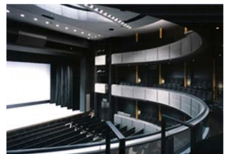
演劇系ホール：出演者の表情や身振りなどが鑑賞でき、一体感が味わえるよう舞台と客席との距離が工夫されているほか、セリフを聞き取れるよう残響時間を短くしています。