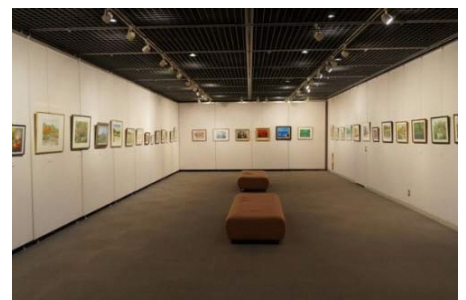
旭区「サンハート」ギャラリー

そのほかにも、「照明設備は光の強さを調節できると良い」、「展示主催者が長期間滞在するため、主催者の休憩や来客との歓談のためのスペースが必要」といった意見がありました。