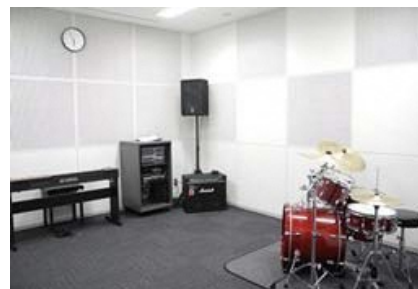
鶴見区「サルビアホール」練習室