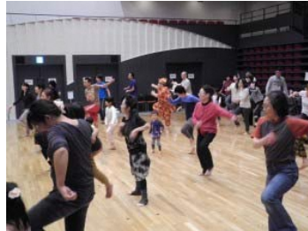
ダンスのワークショップ (参加型事業)