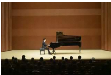
区民文化センター主催公演 (鑑賞型事業)

※区民文化センター主催の自主企画事業の例としては、公演などの鑑賞型事業、ワークショップなどの参加型事業、地域文化を支える人材を育てる人材育成事業、日頃芸術に触れることの少ない人向けに行われる普及事業、まちなかコンサートなどの地域連携事業などがあります。