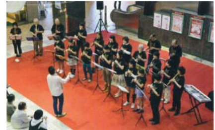
商店街でのコンサート (地域連携事業)

このような役割や事業を実施するためには、それに見合った運営体制を構築することが必要です。例えば、文化活動のコーディネーターや舞台技術者など文化芸術の専門人材の適切な配置や、利用者・来館者が使いやすい利用方法の設定などがこれにあたります。