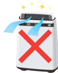
空気清浄機を設置する