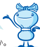
横浜市資源循環局 マスコット ミーオ