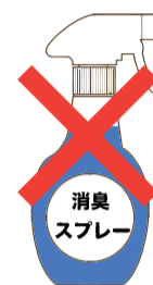
消臭剤を使用する