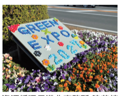
資源循環局港北事務所 脇花壇