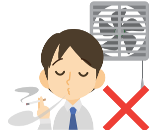
ベランダや屋外、換気扇の下で喫煙する