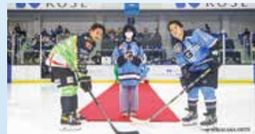
港北区長による記念フェイスオフ(2020年10月ホーム開幕戦)

1月~3月もまだまだ試合があります。競技活動と仕事を両立したデュアルキャリアで世界に挑む横浜GRITSをみんなで応援しましょう!