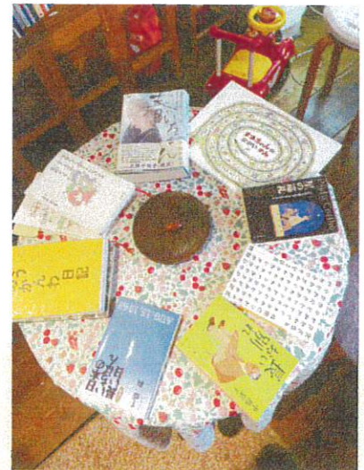
9月のブックカフェ お題は「長」でした

第15回ブックカフェ、7名の参加で開きました。お題は「長」、歴史ドキュメント、伝記小説、絵本、スピリチュアルな旅の記録、「短」編小説を11年の「長」きにわたり読み込んだエッセイなど、今回もバラエティに富んだ本が登場しました！