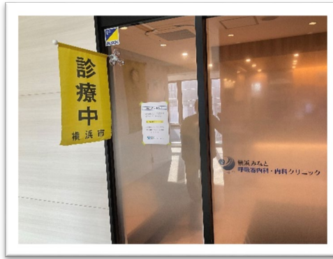
横浜みなと呼吸器内科・内科クリニック