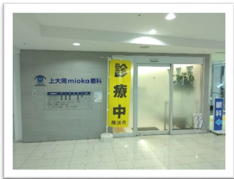
上大岡 mioka 眼科