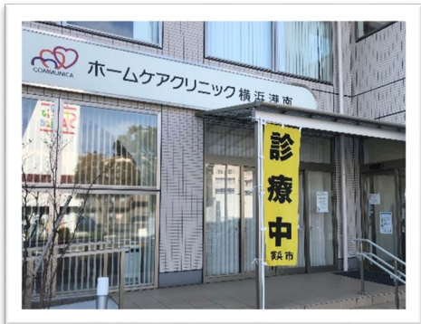
ホームケアクリニック横浜港南