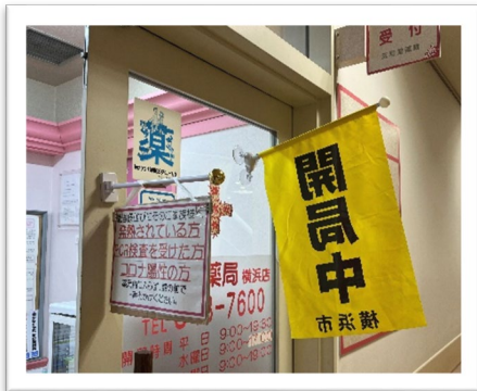
玄和堂薬局横浜店