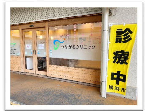
MoLead つながるクリニック