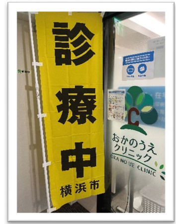
おかのうえクリニック