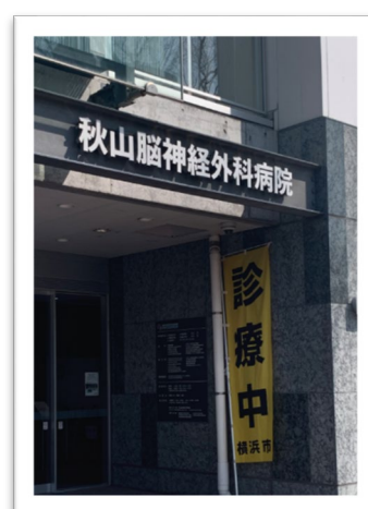
秋山脳神経外科病院