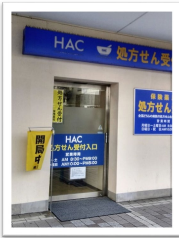
ハックドラッグ港南台バース1店