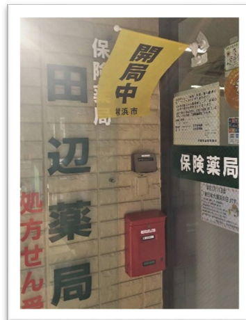
田辺薬局 港南中央店

今回の訓練では 25 の医療機関 から画像提供 いただきました。 ご協力いただき、 ありがとうございました。