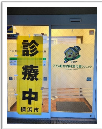
てらおか内科消化器クリニック