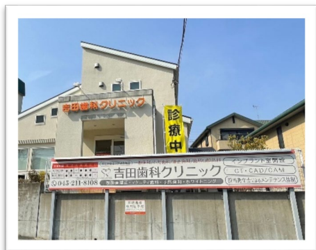
吉田歯科クリニック