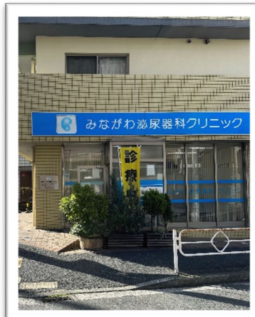
みながわ泌尿器科クリニック