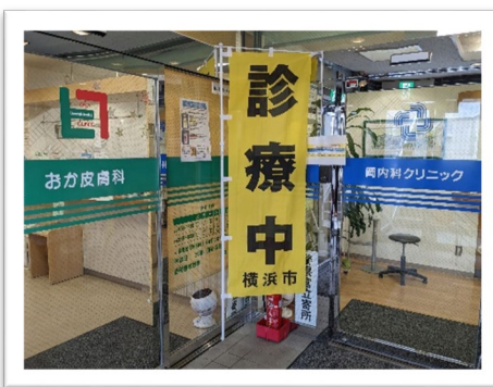
おか皮膚科、岡内科クリニック