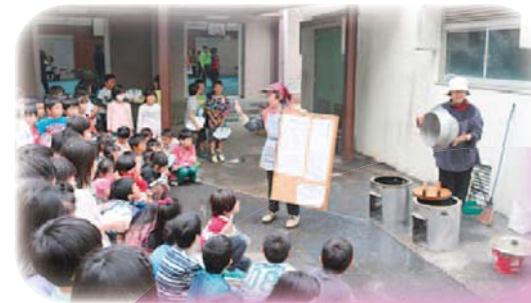
地域防災拠点訓練