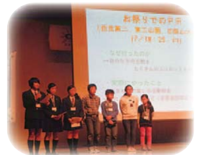
こどもフォーラムでの発表