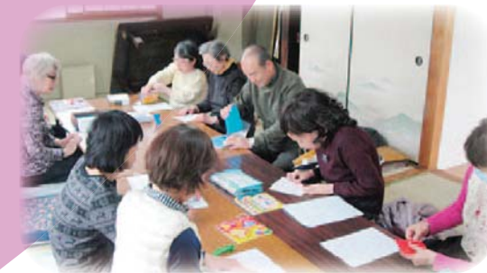
シルバークラブの楽しい活動