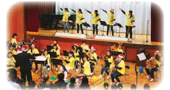
ふれあいコンサート